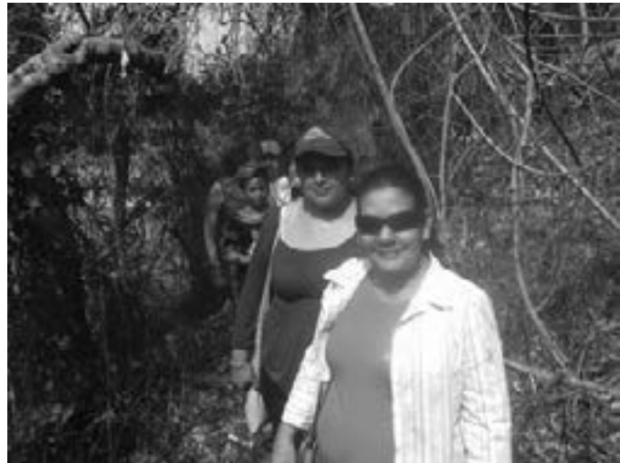
Descendiendo al lago.

Cuentan que allá por el siglo II de nuestra era una colosal explosión volcánica hizo emerger de las entrañas de la tierra un lago, a la vez que destruía las poblaciones originarias que habitaban la zona.